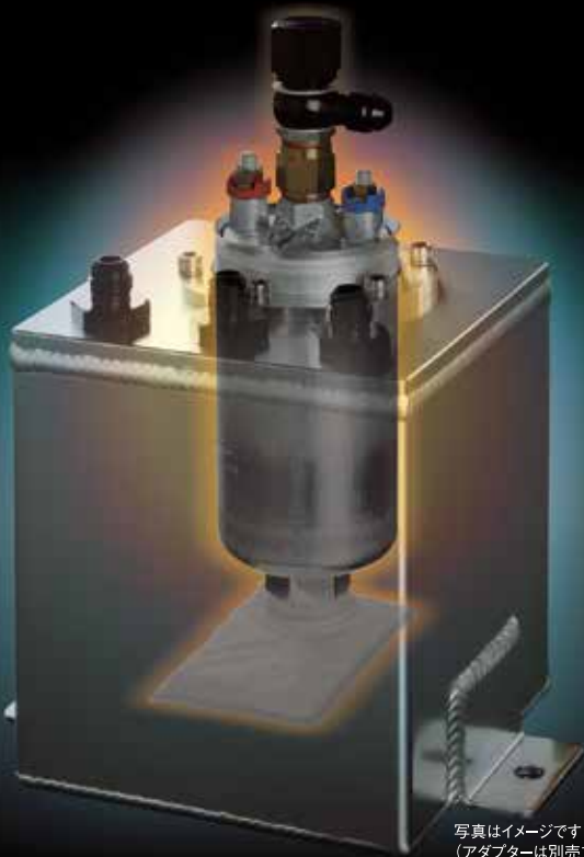
写真はイメージです (アダプターは別売です)