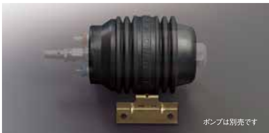
ポンプは別売です