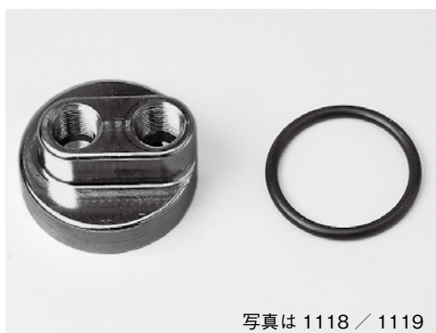
写真は 1118 / 1119