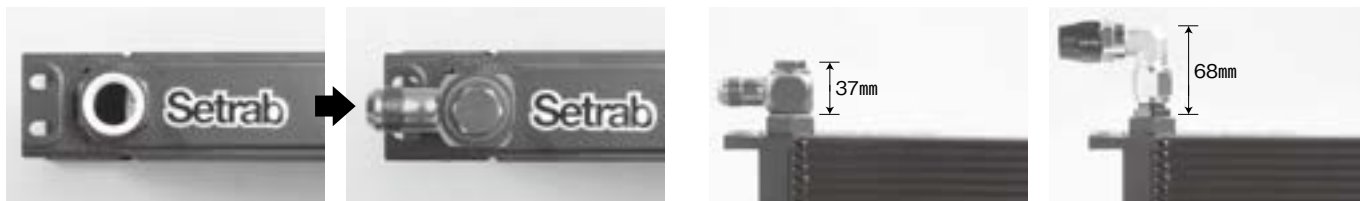
クーラーコアへの取り付け例 (上から)

クーラーコア取り付けやオイルブロック類(ラン・マックス含む)などでスペース的(高さ)の問題が発生した場合には是非…。省スペース設計で問題解消かな？