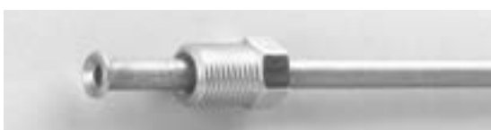
主に国産車の場合