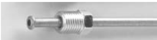
主にヨーロッパ車の場合