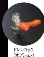
ドレンコック (オプション)