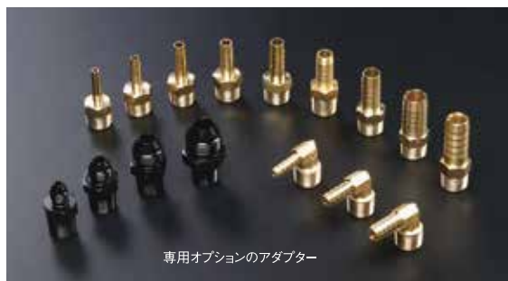
専用オプションのアダプター