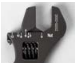
ナット側サイズ刻印表示