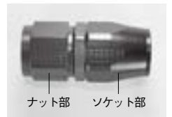
ナット部 ソケット部