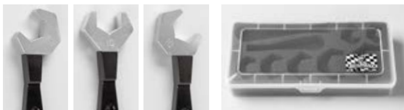
差し替えて3パターンの角度が選べます