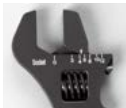
ソケット側サイズ刻印表示

これ1本有ればホースエンドの#3~#12までのナット部、ソケット部両方の締め付けが出来ます。コンパクト(手のひら)サイズでグリップも波型形状(〰)ですので手になじみやすく、狭い場所でも力が入る設計になっています。レンチ表面にはサイズ番号がひと目でわかるようにナット部、ソケット部を表裏別々に分け、刻印で表示して有ります。又、レンチ先端厚みも通常(アールズ、他)9.0mmの所を12.7mmまで増しているのので“がっちり”くい込み、キズ、すべり防止に役立ちます。