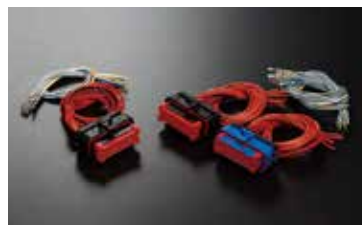
コネクタ1個とターミナル + ケーブルセット (オプション)