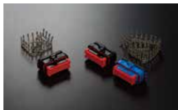
コネクタ1個とターミナルセット (オプション)