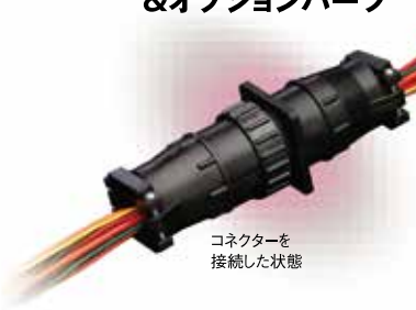
コネクタを 接続した状態

UV耐性に優れたULF1規格の樹脂を用いた丈夫なコネクタ。接点数が多いにもかかわらず円形状のためスペース効率に優れています。オプションで接続ピンを取り外す工具やケーブルクランプもラインナップしています。電流量とターミナル数の異なる2種類をご用意。