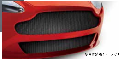
写真は装着イメージです