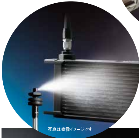
写真は噴霧イメージです