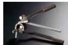
ラン・マックス ▶ P374 参照 チュービング(パイプ)ベンダー