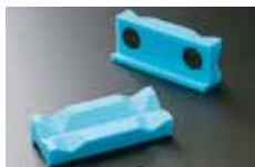
ラン・マックス ▶ P372 参照 MCナイロンバイスジョー