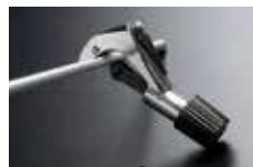
ラン・マックス ▶ P364 参照 チュービングパイプカッター