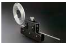
ラン・マックス ▶ P364 参照 チューブストレートナー