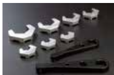
ラン・マックス ▶ P369 参照 ANアルミホースエンドレンチセット